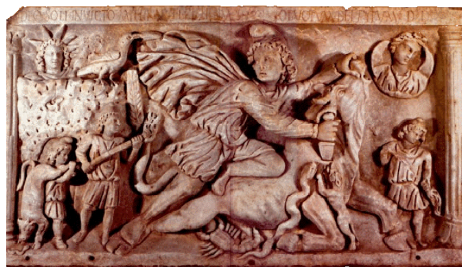
Mitreu del Circ Màxim (s. III dC, Roma)